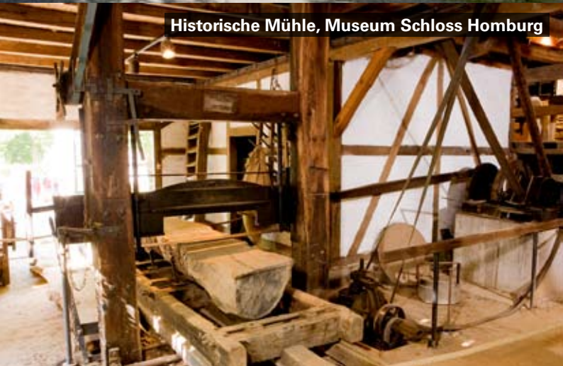
Historische Mühle, Museum Schloss Homburg