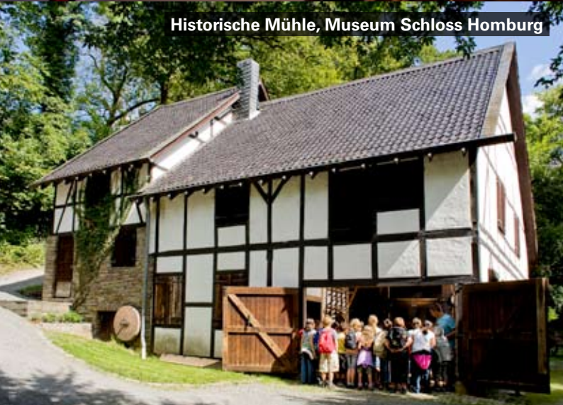
Historische Mühle, Museum Schloss Homburg