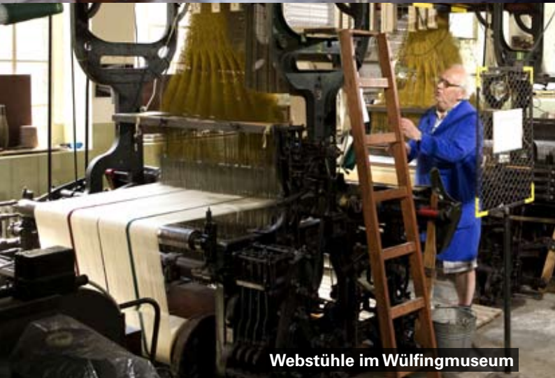
Webstühle im Wülfingmuseum