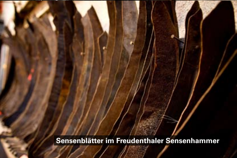
Sensenblätter im Freudenthaler Sensenhammer